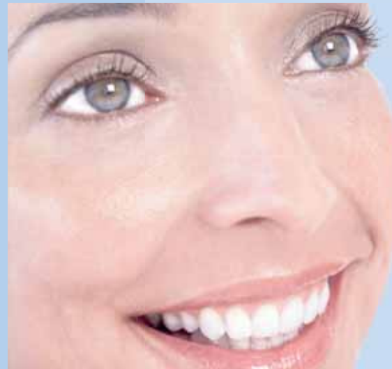
Ein schönes Lächeln kann den ersten Eindruck eines Menschen stark prägen.

Das keramische Material lässt das Licht leicht durchschimmern, so dass Veneers eine ganz besonders natürliche Wirkung haben. Dieser Aspekt stellt einen wesent-